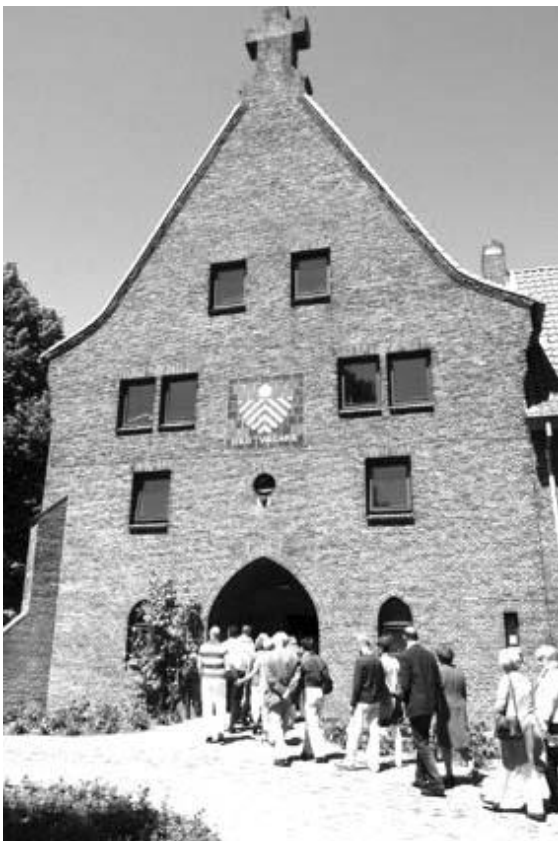
Op weg naar de kapittelzaal.