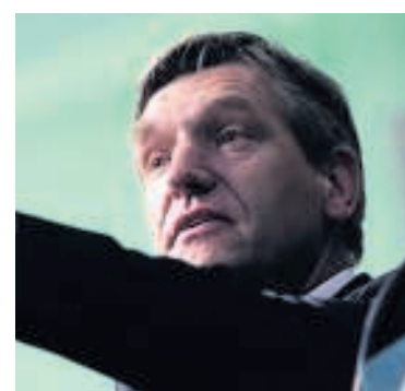
Sybrand van Haersma Buma