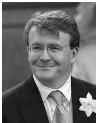
Johan Friso van Oranje-Nassau van Amsberg

Op 12 augustus 2013 is op 44-jarige leeftijd Prins Johan Friso overleden. Nog dezelfde dag werd door de Rijksvoorlichtingsdienst een digitaal condoleanceregister geopend. Het bestuur laat u weten hiervan gebruik te hebben gemaakt en haar innige deelneming aldaar heeft opgetekend (zie onder). Nogmaals willen we ook vanuit de Cocon zijn vrouw Mabel, zijn kinderen Luana en Zaria, maar uiteraard ook de gehele Oranje-familie veel sterkte toewensen met het verlies van hun geliefde. Vooral ook door de bijzondere meelevendheid van Prinses Beatrix voor en op de Dag Herdenken Geweldsslachtoffers, is het alsof er één van onze familie is heengegaan.