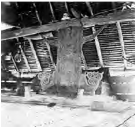
Tuva, Tanimbar Islands (Molukken), 1847

In het Tropenmuseum is wel het een en ander te vinden wat in mijn zoektocht van pas komt. Op de afdeling van Indonesië wordt een Moluks voorouderaltaar (Tavu) tentoongesteld.