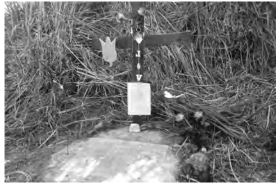
Gedenkkruis op 'de plek' geplaatst door de gemeenschap van Chugchilan

De ouders zijn allen veroordeeld. De hoofddader kreeg 16 jaar en is vanwege goed gedrag inmiddels al weer vrij. Hij moet zich wel elk weekend melden en zit dan alsnog vast. De tweede verantwoordelijke heeft acht jaar gekregen en is inmiddels echt vrij. De jongen heeft één jaar gekregen en is weggetrokken uit die buurt en een heel nieuw leven begonnen. Ik houd me niet bezig met de ouders, nooit gedaan ook. Ik heb geen wraakgevoelens en heb altijd gedacht: 'ik ben 38 jaar en ben niet van plan de rest van mijn leven met mijn verdriet zielig te blijven'!