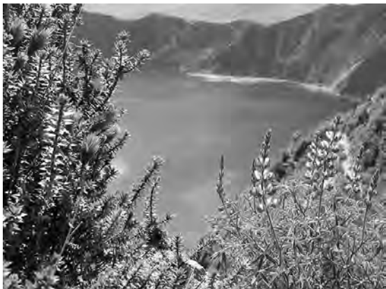
Quilotoa Lake, Ecuador