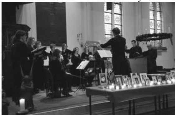
Vocaal Ensemble PUUR

De bijeenkomst in Leusden op 13 december was weer een warm en hecht samenzijn.